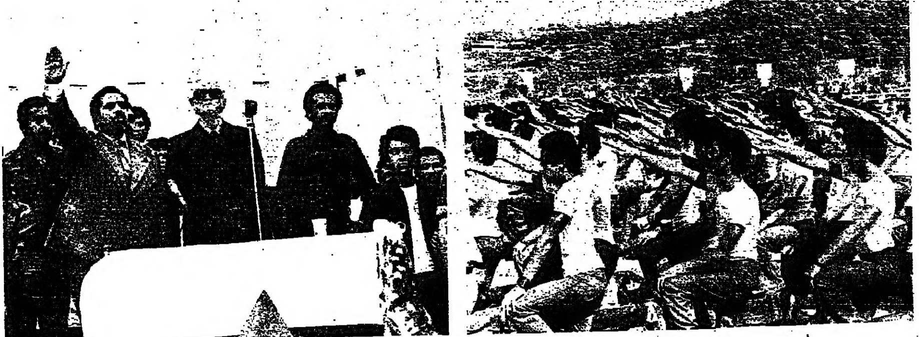
جانب من التضمين الجدد الى حزب الاحرار يؤدون القسم